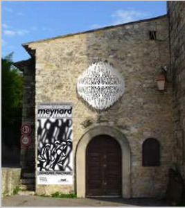
Salle Saint-Esprit place de l'Eglise / Village