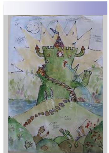
Le château de la princesse, thème de la fresque en chantier à l'école Campouns